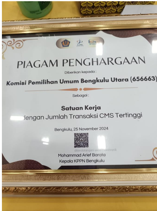
Gambar 3: Piagam Penghargaan sebagai capaian kinerja lain pada tahun 2024