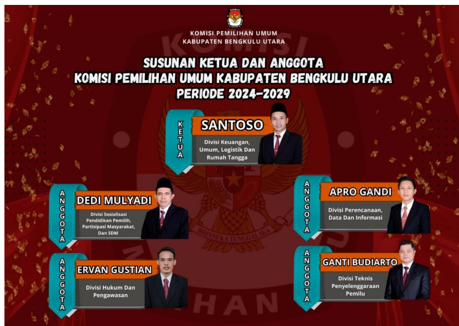
Gambar 1: Struktur Organisasi KPU

Berdasarkan Undang-undang Nomor 7 Tahun 2017 tentang Penyelenggaraan Pemilihan Umum menetapkan bahwa jumlah anggota KPU Kabupaten/Kota terdiri dari 5 (lima) orang. Dalam menjalankan tugas KPU Kabupaten Bengkulu Utara dibagi kedalam 5 (Lima) divisi antara lain: