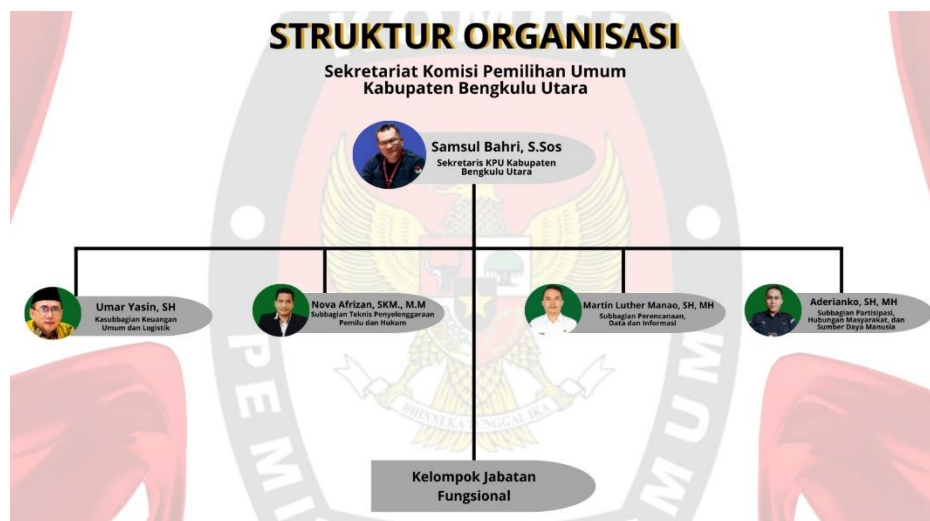
Gambar 2 : Struktur Organisasi KPU Kabupaten Bengkulu Utara

Berikut struktur organisasi Sekretariat KPU Kabupaten Bengkulu Utara Tahun 2024.